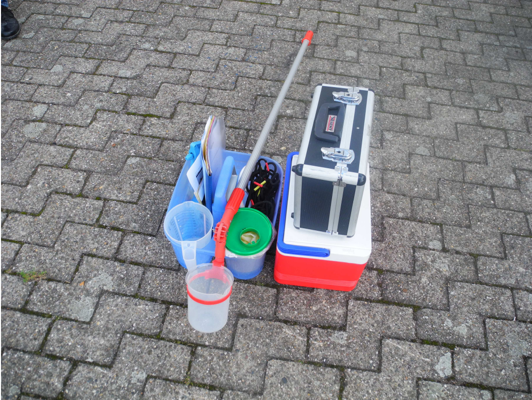
Utensilien, die für eine Gewässerprobe erforderlich sind.

Die Proben werden 30 cm unter der Oberfläche des Gewässers bei einer Wassertiefe von mindestens 1 m entnommen.