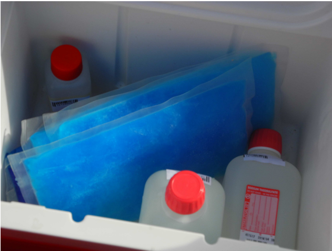
Für den Transport kommen die Proben in eine Kühlbox