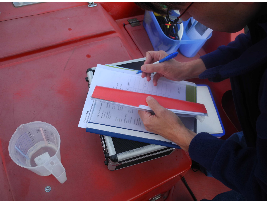
Sorgfältiges Protokollieren aller Daten vor Ort