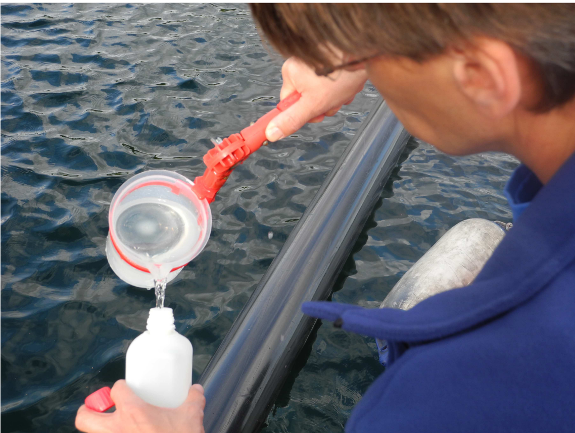
Abfüllung der Probe für die Analytik im Labor